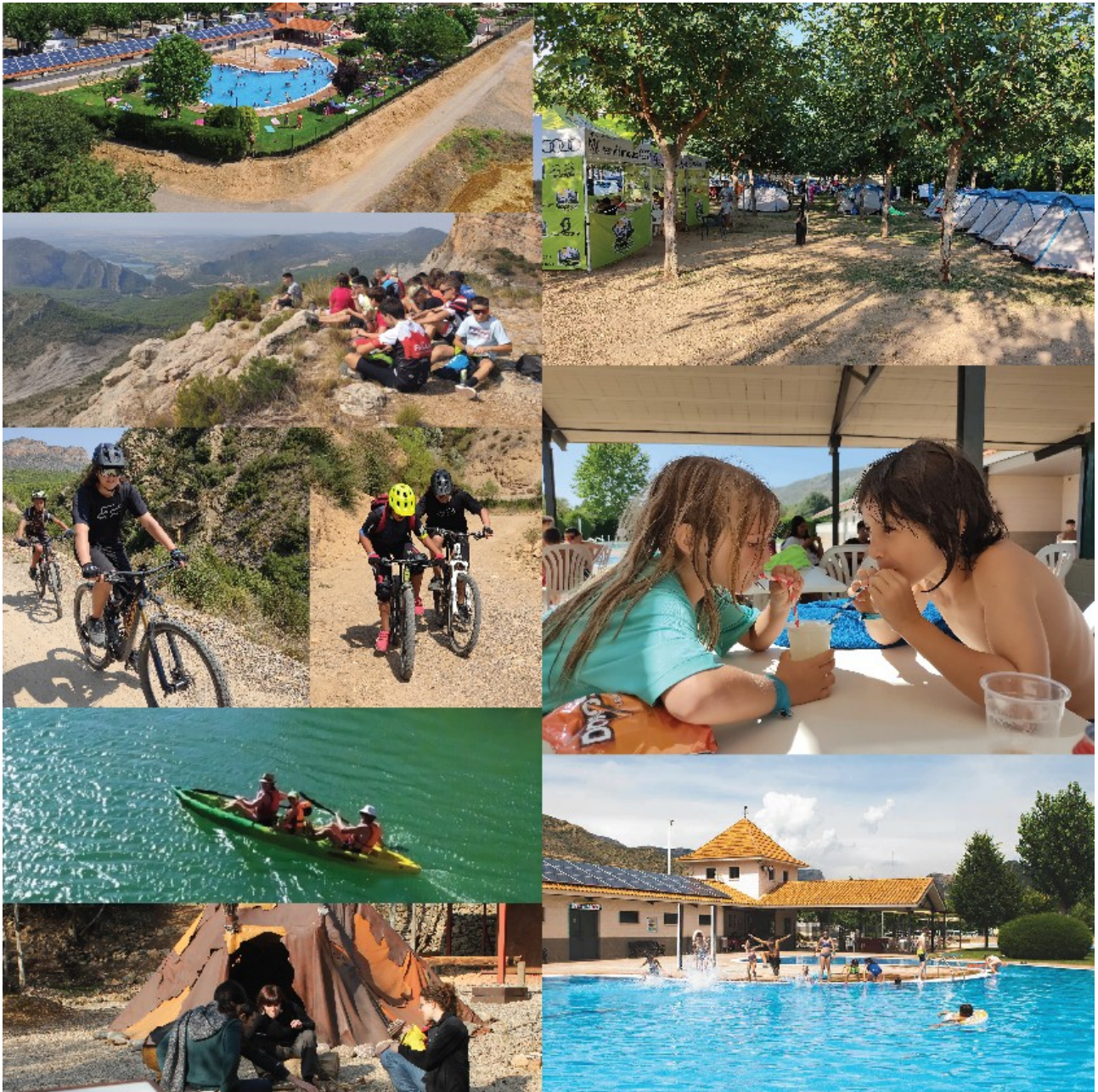
Bike Aventura Cami de Palau KM 1 S/N, 25245 Vila-sana